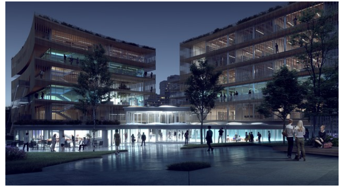
Campus Neubau der Pôle Universitaire Léonard de Vinci, Partnerhochschule Paris

Das Sommersemester 2021 ist nun schon das dritte Online-Semester aufgrund der Corona-Krise.